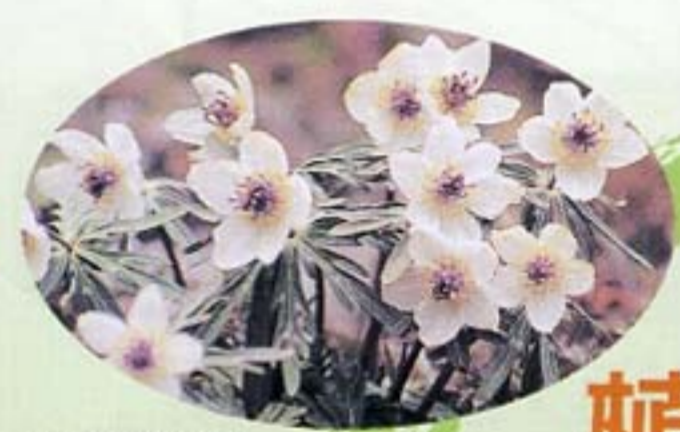
セツブン草 (見頃2月下旬～3月上旬)

自然環境に恵まれた中にあり、春のセツブンソウ・カタクリに始まり季節の野草や秋の紅葉とかわるがわる目を楽しませてくれます。