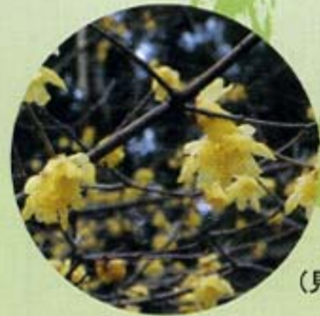
ロウバイ (見頃1月中旬～3月上旬)