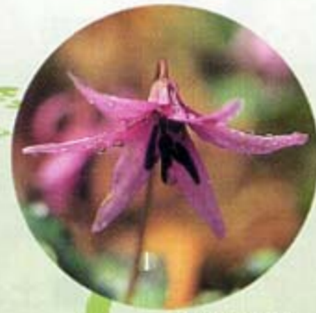
かたくり (見頃4月はじめ頃)